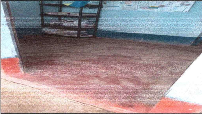
Foto1: CAMBIO DE PISO POR AZULEJOS